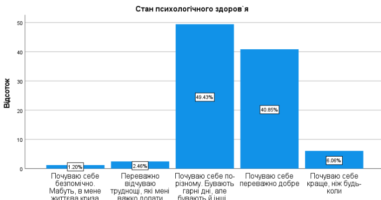
Рис. 3. Самооцінка респондентами стану психологічного здоров'я

Роль стану психологічного здоров'я (рис. 3) в регресійній моделі є цілком очікуваною і очевидною, адже ця змінна статистично виразно і переконливо впливає на імовірності потрапляння респондентів у протилежні групи (табл. 2).