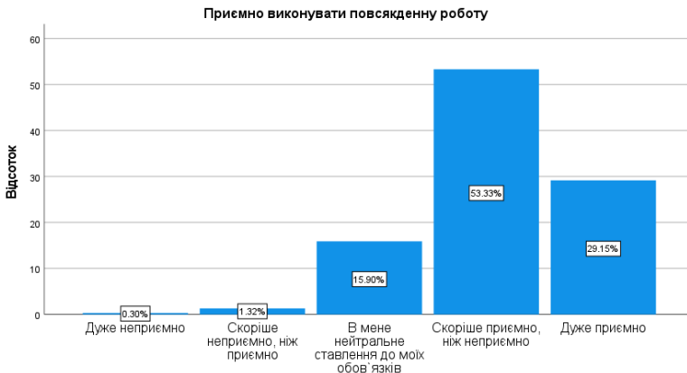
Рис. 4. Емоційне ставлення до праці респондентів (складено автором)

Щодо з'ясування ставлення до праці, то при розробці дизайну дослідження ми вирішили відмовитися в опитувальнику від традиційно широкоживаної лінгвосемантичної концепції «задоволення» на користь такої редакції відповідного запитання: «Зазвичай наскільки по-людськи Вам приємно виконувати повсякденну роботу?» (рис. 4). Ми вважаємо, що більш емоційно-орієнтований підхід стимулюватиме більшу автентичність відповідей респондентів. Результати відповідного регресійного аналізу представлено в табл. 3.