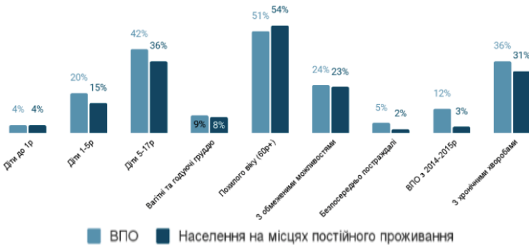
Рис. 3. Найбільш вразливі сегменти населення [5]