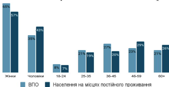
Рис. 2. Вікова структура ВПО та населення на місцях постійного проживання [5]

щення. За даними Міжнародної організації з міграції, понад 7,1 млн людей (16 % населення країни) стали внутрішньо переміщеними особами [5]. Розрахунки переміщення між областями (виконані за демографічними даними та методами геолокації) показали, що станом на 15. 05. 2022 року майже 7 млн осіб перемістились з області свого постійного проживання, що вплинуло також на вікову структуру населення, бо більшість жінок усіх вікових груп, дітей та підлітків покинули свої регіони. Поміж усіх, хто переїхав у межах країни, 72 % мали друзів чи родичів у місцях, де вони тимчасово перебували. Факт наявності друзів чи родичів став вирішальним для 31 % опитаних [6]. Більшість переміщених осіб – це жінки віком від 25 років, а найактивніше виїжджали жінки у віці 25–45 років. Внаслідок міграції зміниться вікова структура населення країни. За даними польських дослідників, середній вік українських біженців – 36 років. Отже, з України виїжджає найбільш працездатне населення та діти (рис. 2).