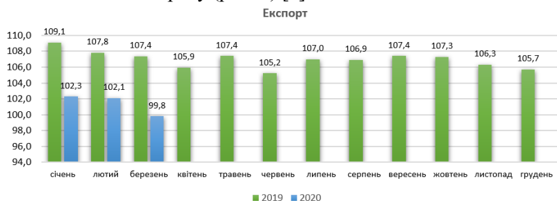
Рис. 1. Темпи зростання (зниження) експорту товарів, % (складено автором за даними ДССУ)

1. Негативне зовнішньоекономічне сальдо – за даними НБУ, поширення COVID-19 мало обмежений вплив на експорт товарів, але знизило імпорт товарів та послуг. Незважаючи на економічну кризу, зовнішня торгівля України товарами в I кв. 2020 року залишилася майже без змін. Статистичні дані Державної служби статистики України показують, що в I кв. 2020 року експорт товарів становив 12 251 млн дол. США, або 99,8 % у порівнянні з I кв. 2019 року (рис. 1) [7].