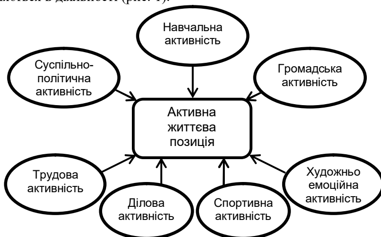
Рис. 1. Складові активної життєвої позиції

колективу, самого себе, природи, навчання, праці тощо) і виявляється в діяльності (рис. 1).