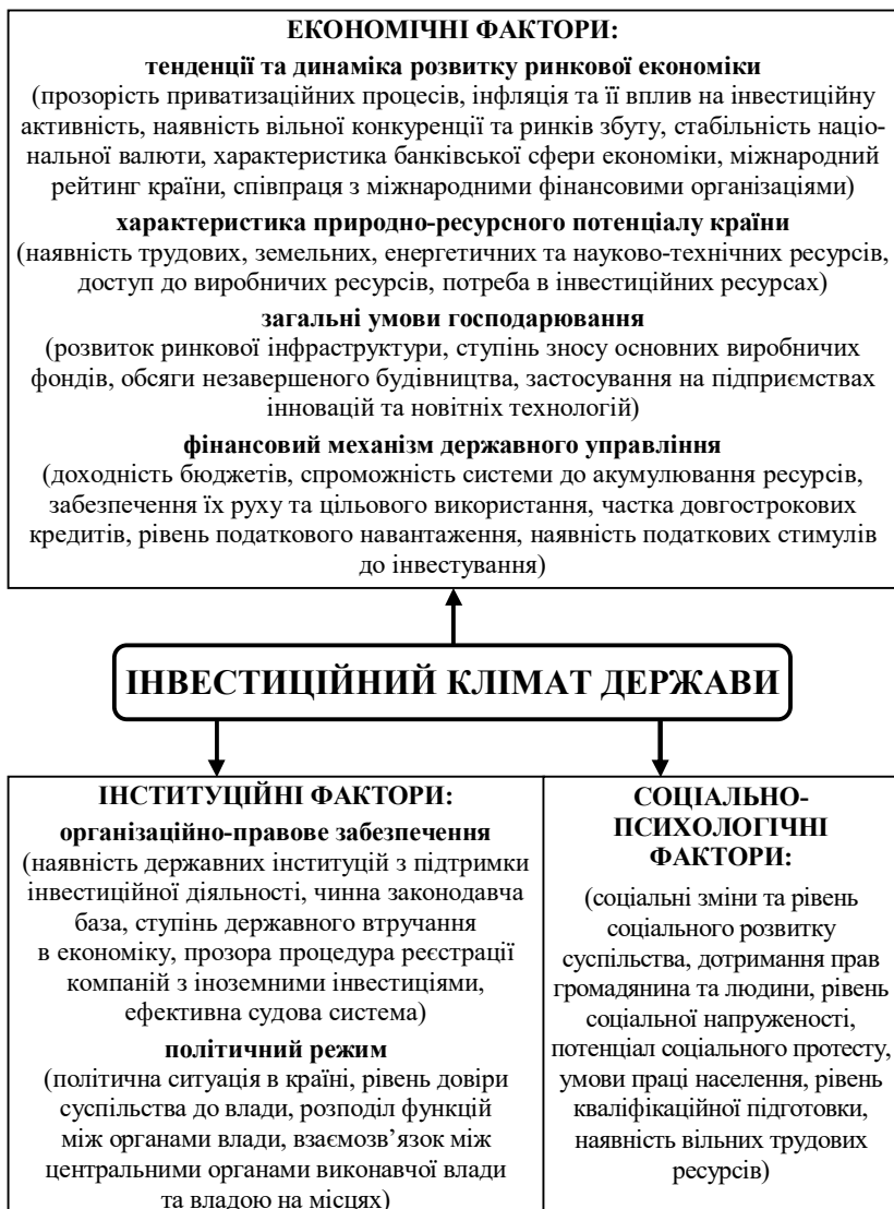
Рис. 1. Комплекс факторів, який забезпечує інвестиційний клімат в Україні